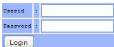
Gambar 1. Fasilitas pemasukan akun perpanjangan ijin (Userid dan Password)

Mendaftarkan diri sebagai pengguna situs web dengan fasilitas akses sesuai dengan yang dialo-kasikan oleh pengelola sistem (system administrator). Fasilitas pemasukan akun tersebut terda-pat pada sebelah kanan atas pada laman.