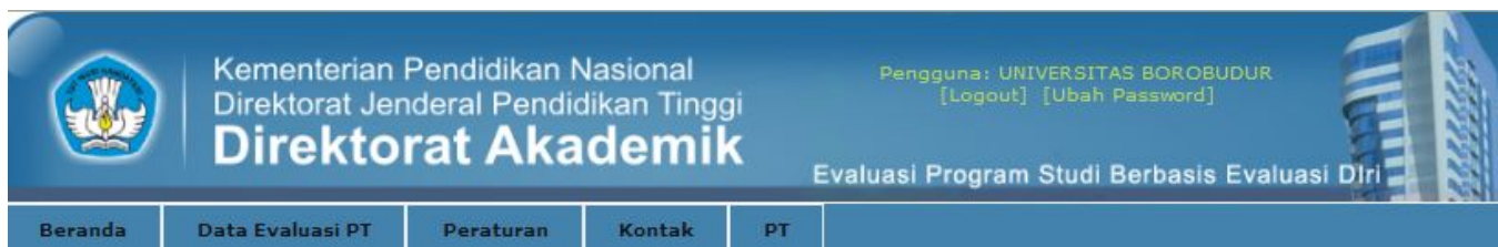
Gambar 2. Tampilan menu bagi akun yang menggunakan fasilitas akun PTS.

Petunjuk: Masukkan akun (userid dan password) Saudara dengan benar pada isian yang telah disediakan dan tekan tombol 'Login', seperti yang terlihat pada Gambar 1 di atas. Dalam mema-sukkan 'password' posisi 'Caps Lock' pada keyboard komputer harus 'off' karena masukan data password memiliki sensitivitas masukan huruf (case sensitive). Bila akun yang Saudara masukan salah, maka isian pada Userid dan Password akan kembali kosong; dan bila akun Saudara dite-rima maka akan terjadi perubahan pada menu utama pada halaman utama, dengan penamba-han menu utama 'PT', seperti yang terlihat pada Gambar 2.