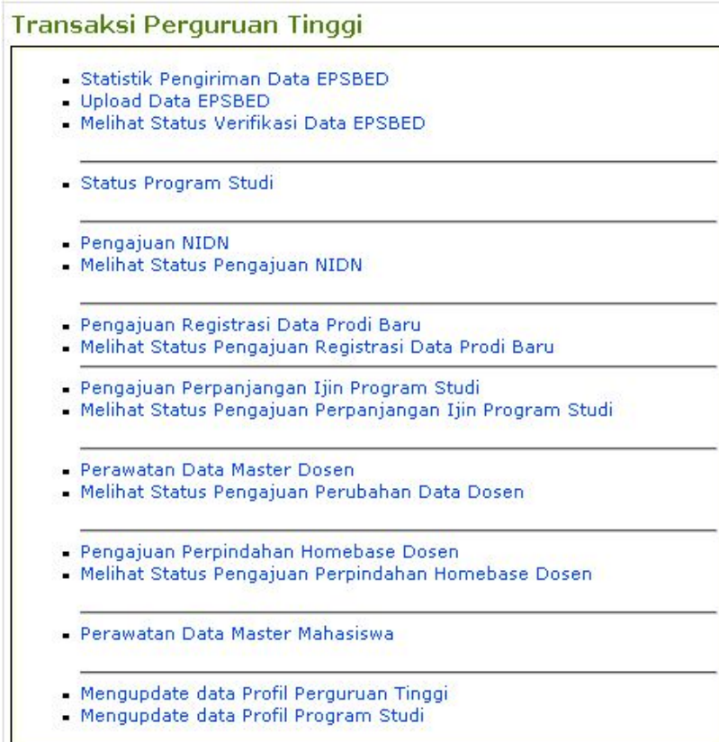
Gambar 3. Tampilan sub menu untuk fasilitas akun PTS yang dapat digunakan untuk melakukan berbagai macam kegiatan administrasi

Kegiatan pengajuan perpanjangan ijin program studi dimulai dengan mengklik menu 'PT' pada halaman utama, yang terletak pada urutan paling kanan dan tampilan layar akan menghasilkan sejumlah sub menu seperti yang terlihat pada Gambar 3. yang berikut.