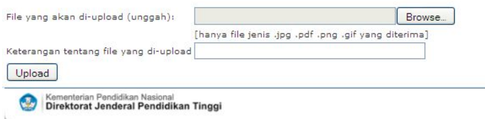
Gambar 7. Tampilan menu untuk mengupload dokumen penunjang untuk perpanjangan ijin program studi di PTS

Klik tombol 'Browse' untuk mencari folder tempat menyimpan file surat permohonan yang telah discan. Untuk memberi keterangan tentang isi surat tersebut, isikan informasi singkat pada isian 'Keterangan tentang file yang di-upload'; dengan teks nama program studi yang diajukan, 'S1 Matematika'. Selanjutnya, klik tombol 'Upload' dan dengan demikian proses pengajuan perpanjangan ijin telah selesai.